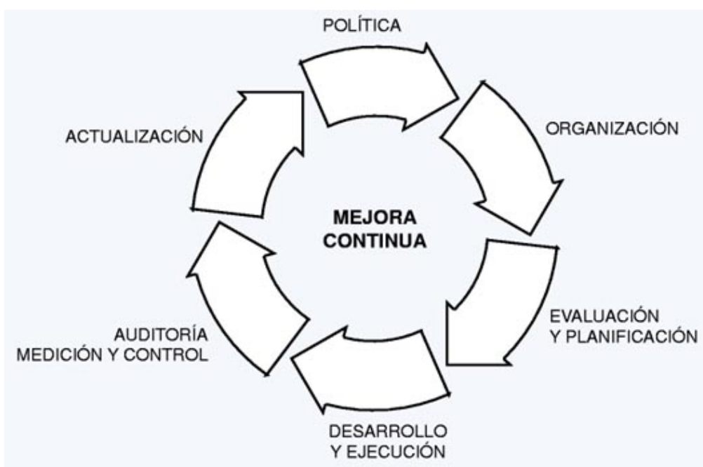
Figura 2 La mejora continua, elemento esencial de los sistemas

Las indudables ventajas de un sistema unitario serían entre otras, la disminución de la burocracia y de los costes de implantación, una mejor formación integral de los miembros de la organización y, como consecuencia, una más racional y eficaz gestión empresarial.